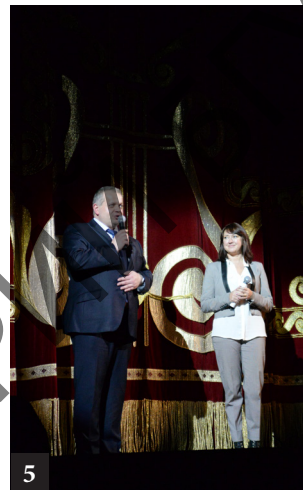
3, 4, 5. Пастаўка мюзікла «Дубровскі» на музыку К. Брэйтбурга, лібрэто К. Кавалерыяна

В 2015 г. студэнтамі кафедры народнапесеннага творчэства была выканана харавая сім-