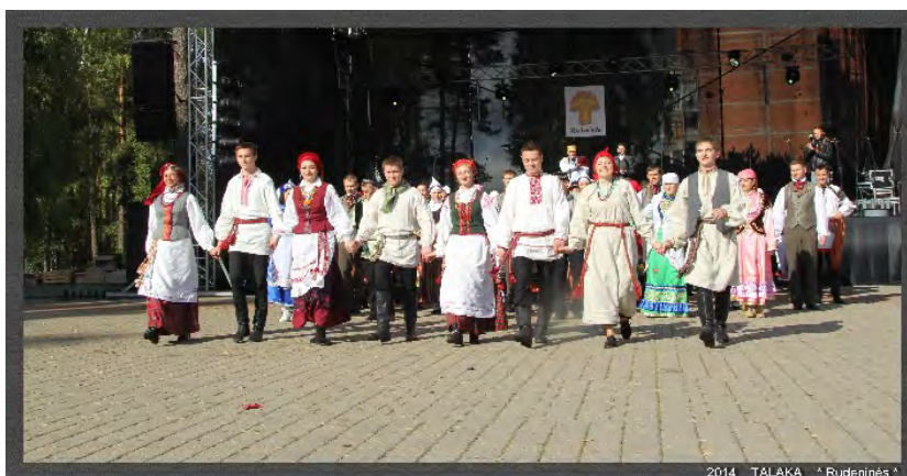
Рисунок 2 – Фольклорная группа «Талака» БГУКИ на фестивале представляет Беларусь, 2014.

На проведение межнационального и международного фольклорного форума именно в Висагинасе, безусловно, оказала влияние специфика этого города. Висагинас (Visaginas) – город в восточной части Литвы, в