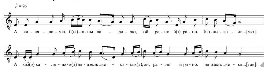
Малюнак 1 – Нотныя прыклады.