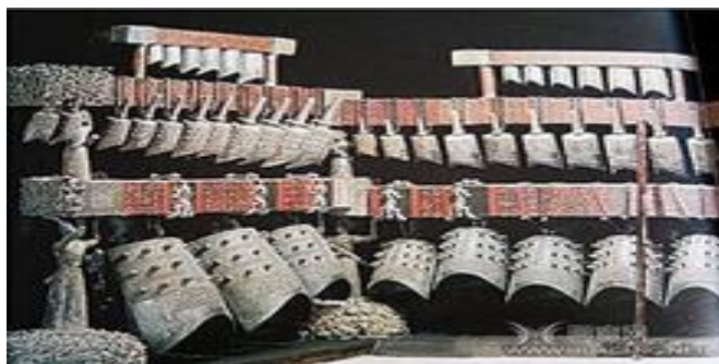
Рис. 2. Древний китайский инструмент бяньчжун

аналогии с мелодиями из шести нот, пропетыми самкой и самцом птицы феникс (6 женских и 6 мужских нот) [1, с. 14].