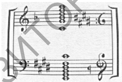
Рис. 3. Нотный пример

В соответствии с «Четырьмя символами» в философии Тайцзи композитор создал аккорды «Четыре символа», в каждом из которых из трех звуков на полутон повышался один (рис. 4).