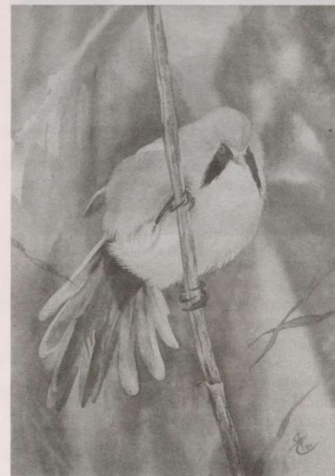
«Сініца вусатая», 2024 г.