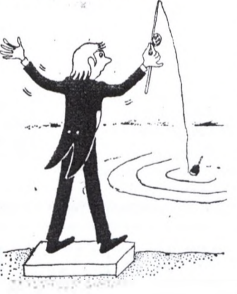
Малюнкі Наталлі ДОРАШ.