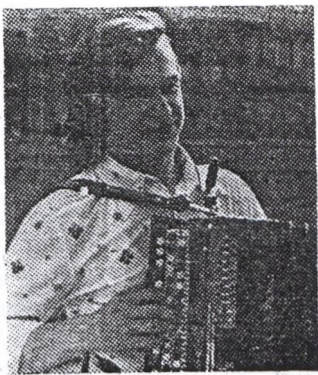
(Заканчэнне. Пачатак на 1-й стар.)