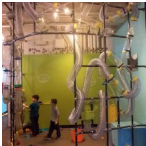
Рис. 4. Детский музей в Провиденсе, США

Кроме того, большинство американских музеев демонстрируют наличие специальных зон для отдыха, развлечения и получения дополнительной информации, представленных в виде интернет-кафе, магазинов, специальных информационных центров, отдельных помещений для отдыха и развлечения. В качестве примера рассмотрим Музей Изабеллы С. Гарднер в Бостоне (Isabella Stewart Gardner Museum) (рис. 5) [3]. Специальная зона отдыха, совмещенная с небольшой публичной библиотекой, позволяет посетителям отдохнуть после просмотра достаточно обширной экспозиции и одновременно почитать книги, побеседовать с другими посетителями или просто насладиться легкой музыкой, звучащей в зале. Дополнить впечатление от посещения музея можно, посетив концертный зал, где проходят различного рода мероприятия. Хотелось заметить, что в практику большинства современных музеев входит проведение публичных мероприятий, для чего многие музеи оборудуют специальные театральные и концертные площадки, которые позволяют переместить сценическое и музыкальное искусство в пространство музея.