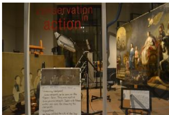
Рис. 7. Реставрационная мастерская в экспозиции Музея изобразительного искусства, Бостон, США

состояние предмета, его преобразование в процессе реставрации и конечный вариант. Такое простое, но очень оригинальное решение позволяет рассказывать посетителю о той деятельности, которая обычно остается скрытой от его глаз. Такого типа классы становятся отличной базой для проведения занятий и знакомства с работой реставратора, хранителя коллекций и другими интересными «музейными» профессиями.