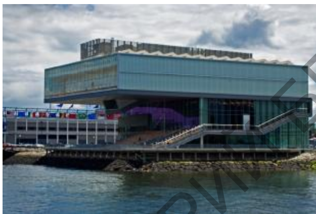
Рис. 2. Институт современного искусства, Бостон, США

лы, просторный холл, «зеленый» дизайн позволяют проводить множество мероприятий от театральных постановок до детских праздников, от музейных вечеринок до индивидуальных выставочных проектов, от неформальных встреч с современными художниками до интерактивных игр и перформансов. Сочетание функциональности и архитектурной эстетичности – важное качество музейного здания, что позволяет превратить его в экспериментальную площадку для реализации самых смелых авторских проектов. Заметим, что разнообразные культурные проекты далеко не редкость для современной американской музейной практики, что способствует привлечению в стены музея широкой аудитории.