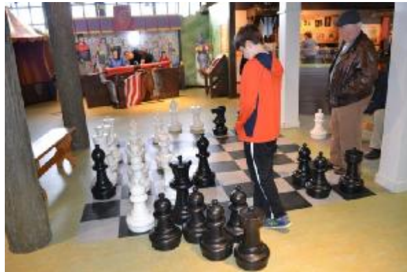
Рис. 3. Игровая зона в Музее рыцарства Дж. В. Хиггинса, Вустер, США

Отдельно хочется упомянуть о детских музеях, которых в Америке большое количество. Детские музеи представляют собой интересный симбиоз музея и игрового центра. Детский музей в Провиденсе (Providence Children's Museum) ориентирован на детей разного возраста (рис. 4) [1]. Каждый зал музея открывает перед ребенком новый интересный мир, который развивает его интеллектуальные и физические способности. Интерактивные элементы, специальное оборудование и различного рода игры создают особое пространство, способное увлечь не только детей, но и взрослых. С точки зрения музеологии интерес представляет коллекция игрушек и другой соответствующей атрибутики из разных стран мира. Витрины с предметами гармонично включены в общемузейное пространство и являются логичным дополнением экспозиции.