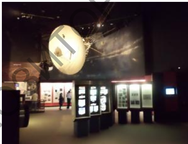
Рис. 6. Национальный музей космонавтики, Вашингтон, США

В этой связи немного хочется сказать об организации экспозиционного пространства музея. Не будем останавливаться на базовых моментах экспозиционного дизайна, лишь отметим некоторые, на наш взгляд, наиболее удачные решения экспозиционного пространства, увиденные нами в музеях США. Важно заметить, что в оформлении современных музеев можно выделить некоторую общую тенденцию: в большинстве это погруженные в темноту залы, с яркой точечной подсветкой, хаотичным или систематичным делением экспозиционного пространства и активным использованием дополнительного плоскостного материала, специальных интерактивных панелей, объемных моделей, красочных информационных стендов и т.д. В качестве примера приведем экспозицию Национального музея космонавтики в Вашингтоне (Smithsonian National Air and Space Museum) (рис. 6) [7]. Залы этого музея наполнены огромным количеством экспонатов и дополнительными материалами научно-вспомогательного характера, что позволяет создать невероятную атмосферу, которая погружает посетителя в загадочный космический мир.