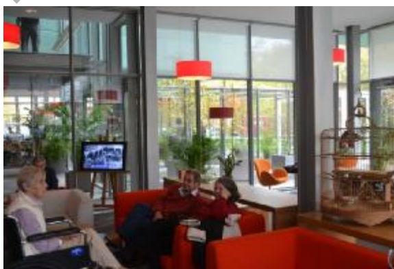
Рис. 5. Публичная библиотека в Музее Изабеллы С. Гарднер, Бостон, США

Кроме того, большинство американских музеев демонстрируют наличие специальных зон для отдыха, развлечения и получения дополнительной информации, представленных в виде интернет-кафе, магазинов, специальных информационных центров, отдельных помещений для отдыха и развлечения. В качестве примера рассмотрим Музей Изабеллы С. Гарднер в Бостоне (Isabella Stewart Gardner Museum) (рис. 5) [3]. Специальная зона отдыха, совмещенная с небольшой публичной библиотекой, позволяет посетителям отдохнуть после просмотра достаточно обширной экспозиции и одновременно почитать книги, побеседовать с другими посетителями или просто насладиться легкой музыкой, звучащей в зале. Дополнить впечатление от посещения музея можно, посетив концертный зал, где проходят различного рода мероприятия. Хотелось заметить, что в практику большинства современных музеев входит проведение публичных мероприятий, для чего многие музеи оборудуют специальные театральные и концертные площадки, которые позволяют переместить сценическое и музыкальное искусство в пространство музея.