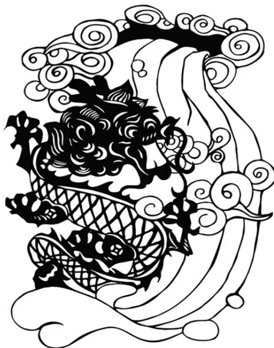
Рис. 4. Зверь, выходящий из моря

лено большое количество узоров в виде облаков и воды, создающих гиперболизированное изображение персонажей, которые возносятся на облаках и едут на тумане. Например, на одной из иллюстраций тотем «драконовы письма», согласно легенде вынесенные водяным драконом из р. Хуанхэ, и узор Ушуй – разновидность узора вздымающейся волны, используются для изображения зверя, выходящего из моря (рис. 4).