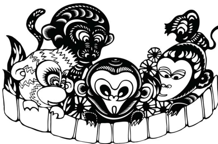
Рис. 3. Иллюстрация к басне «Обезьяны ловят луну»

Оформление басни «Обезьяны ловят луну» выполнено в ярких тонах и обладает особенностями тонкого и деликатного стиля вырезок Южного Китая. Основное внимание уделяется изображению образов главных героев басни – обезьян. В книге можно увидеть пять различных персонажей (рис. 3), каждый из которых имеет свою специфику. Используя декоративность вырезок из бумаги, для более живого изображения мягкой шерсти и мордочек обезьян создатели применили наиболее часто встречающиеся в китайских народных вырезках зубчатые и серповидные узоры.