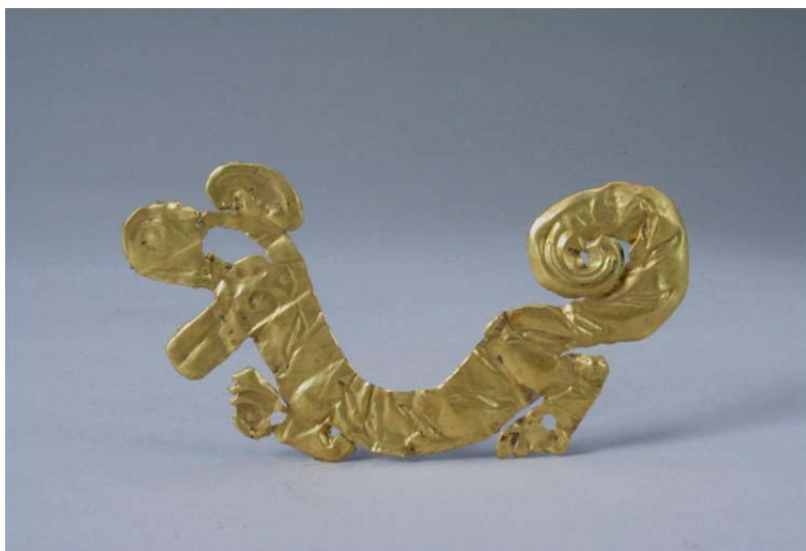
Рис. 1. Украшение из фольги в виде тигра

Уже в эпоху Шан (XVI–XI вв. до н. э.) существовали различные техники вырезания и формы узоров на тонких и мягких материалах для изготовления художественных изделий методом ажурной резьбы. Например, в районе Чэнду при раскопках артефактов культуры Саньсиндуй – археологической культуры позднего неолита и раннего бронзового века (2800–800 гг. до н. э.) – в яме для жертвоприношений было обнаружено украшение из фольги в виде тигра, датируемое серединой эпохи Шан (рис. 1). Изделие длиной 11,6 см, шириной 6,7 см изображает сидящего на задних лапах рычащего тигра с большой, высоко поднятой головой и закрученным хвостом [1, с. 3]. Изящное художественное изделие эпохи Шан можно назвать предшественником вырезок из бумаги, появившихся после ее изобретения в эпоху Хань более двух тысяч лет назад. После того, как в 105 г. Цай Лунь усовершенствовал технологию изготовления бумаги, она начала широко использоваться в качестве сырья для изготовления бумажных орнаментов [2, с. 33].