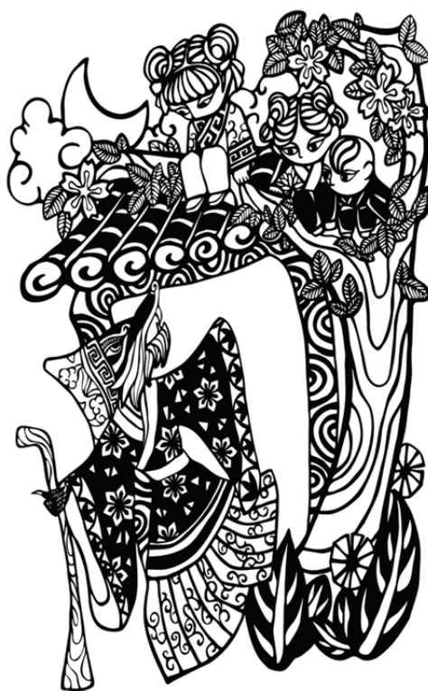
Рис. 5. Иллюстрация к сказке «Волк, притворившийся бабушкой»

Искусство таких поделок совершенствовалось на протяжении тысячелетий и вобрало в себя черты китайской традиционной культуры. Оно является ярким воплощением нематериального культурного наследия Китая [4, с. 18]. Книжная иллюстрация с использованием вырезок из бумаги – одно из направлений современного искусства. Большое количество вырезанных из бумаги иллюстраций делают книги красивыми и яркими, что отвечает художественным потребностям людей. Такие иллюстрации служат ценным художественным элементом дизайна китайских книг, способствуют преемственности молодым поколением традиционной национальной культуры и демонстрируют новые направления в искусстве современной книжной иллюстрации.