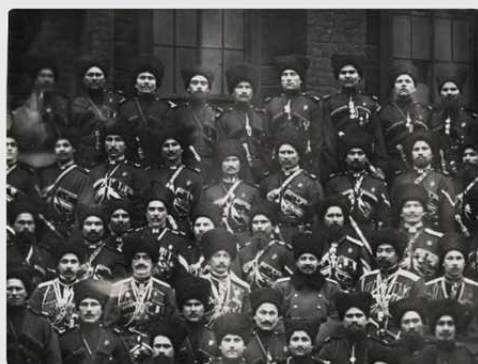
Черкесы. Штутгарт, 1847. Фотокопия Гофман. ГОСКАТАЛОГ.РФ