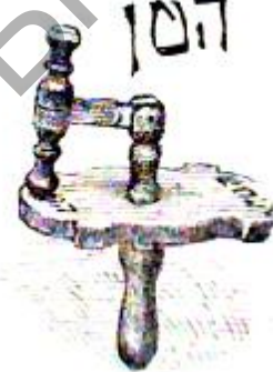
Малюнак 4 – Трашчотка

Як бачна на ілюстрацыях, навукоўца прыводзіць два тыпу дуды: аднагукавую (мал. 1) і трохгукавую (мал. 2) як дуду больш позняга часу.