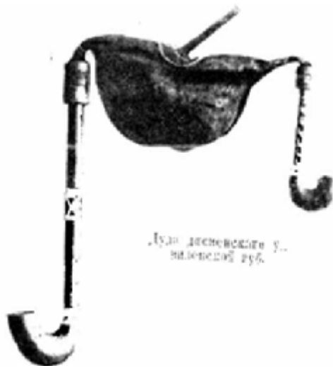
Малюнак 1 – Дуда з Дзісенскага паведа