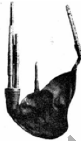
Малюнак 2 – Дуда з Люцынскага паведа

Як і Нікіфароўскі, Раманаў выдзяляе чатыры асноўныя часткі, з якіх складаецца дуда: скураны мех (1), драўляную соску (2), перабор (3) і гук (4) (мал. 3).