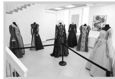
Рисунок 3 – Л. Шилак & О. Матусевич. Коллекция исторических костюмов «Барбара». Минск, 2020 [2]

По мнению В. Калацея [1, с. 33–34], как и в ряде близлежащих регионов Европы, текстиль появился в Беларуси еще в неолите (рис. 1). По мере развития технологий производство большинства промышленных тканей взяли на себя ремизные ткацкие станки, зато и сегодня по старым технологиям все еще изготавливаются авторские гобелены и декоративные вставки для этнографического и исторического костюма, а также различные виды традиционного текстиля для сельского (или стилизованного под сельский) интерьера. Взаимосвязь традиционного текстиля с богатым наследием корневой художественной культуры нашей страны как части европейского культурного пространства обогащает современное искусство, наполняет его глубоким смыслом и содержанием. Вследствие этого, происходит последовательная трансформация трактовок традиционных приёмов композиционной и орнаментальной организации в новые формы. Постепенный процесс преобразования наблюдается во всех видах декоративно-прикладного искусства. Современные произведения большинства белорусских художников-текстильщиков отличаются характерным национальным стилем