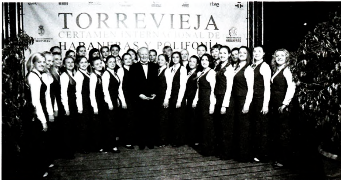
Народная хорвая капелла «Раніца»

вушки в возрасте от 18 до 30 лет. Несмотря на то что в капеллу принимают любителей хорового академического пения, как правило (так уж сложилось исторически), каждая из участниц имеет музыкальное образование (общее, нередко — среднее или высшее специальное). Наличие вокальных данных для участников хоровой капеллы обязательно. Однако, по словам В. С. Масленникова, это не значит, что в коллектив приходят готовые музыканты и с ними не надо работать. На хоровых и индивидуальных занятиях (это важная форма для качественного развития любительского коллектива, но не характерная для работы с ним), большое внимание уделяется постановке голоса, правильной манере пения и чистому интонированию. Несомненно, кропотливая работа ведётся над ансамблем, фразировкой, динамикой, штрихами и пр. Но самое важное — над тембральным унисоном. И всё это подчинено основным задачам: научить участниц капеллы эмоционально воспринимать и исполнять произведения, тонко чувствовать и доносить до слушателя основную суть, заложенную композитором.