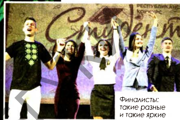
Финалисты: такие разные и такие яркие

В зале Минского городского дворца культуры во вторник вечером было не протолкнуться. Ребята с транспарантами, дуделками и огромными портретами в руках ждали не выступления модного артиста, как можно было подумать, а финала республиканского конкурса «Студент года – 2019».