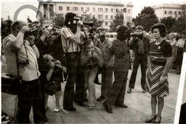
Валянціна Церашкова ў Мінску.

“Ён зірнуў на мяне — і я паспеў ухапіць гэты момант”