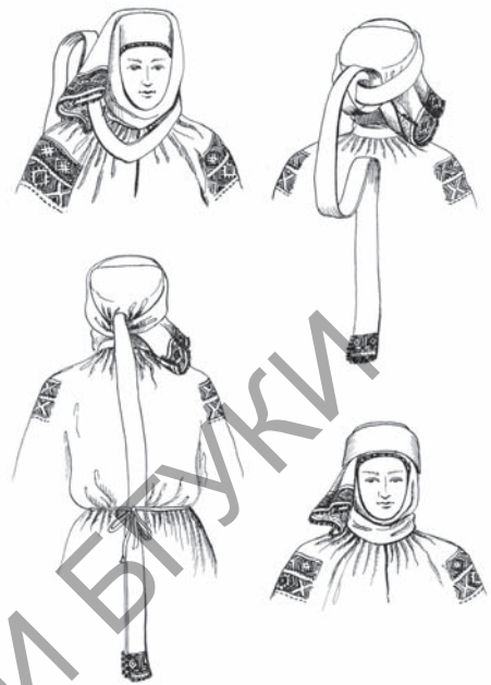
Мал. 7. Спосаб завівання намёта. в. Дразна Старадарожскага раёна Мінскай вобласці. Рэканструкцыя і малюнак М. Віннікавай

Прычоска з валасоў, навітых на спецыяльны абручык — «тканку», пакрывалася плеченым чапцом, паверх якога завівалі намёт (прыкладныя памеры: 285x35 см). Намёт накладалі на галаву ў разгорнутым выглядзе такім чынам, каб правы яго канец быў разы ў тры карацейшы за левы. Ён праходзіў пад падбародкам, падымаўся ўверх з левага боку і перакідваўся цераз верх галавы зноў на правы бок. Яго арнаментаваны край прыкрываў скроню і спускаўся да пляча. Левы канец складваўся ўдоўж у чатыры столкі, праходзіў пад падбародкам і пад правым канцом, ззаду рабіў разварот у бок ілба, абручыкам абыходзіў кругом галавы, працягваўся знізу ўверх праз пятлю, утвараную ім пры развароце і спускаўся ўздоўж спіны (гл. мал. 7, 8).