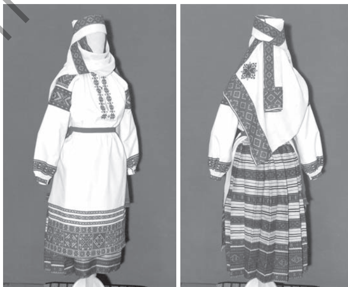
Мал. 4, 5. Касцюм замужняй жанчыны. Першая палова XX ст. Маларыцкі раён Брэсцкай вобласці