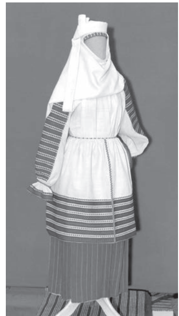
Мал. 2. Касцюм замужняй жанчыны. 1920-я гг. в. Хабовічы Кобрынскага раёна Брэсцкай вобласці

упрыгажэнняў. Дзяўчаты маглі хадзіць з непакрытай галавой, заплятаючы косы, або насілі невялікія палатняныя павязкі з арнаментаванымі канцамі, якія завязвалі ззаду. Асаблівасцю касцюма замужніх жанчын былі галаўныя ўборы ручніковага тыпу, якія цалкам закрывалі валасы. Яны ўяўлялі сабой доўгія (ад 2,5 да 4,5 м) кавалкі тонкага белага палатна з арнаментальным аздабленнем па краях. У розных месцах Беларусі такі галаўны ўбор меў розныя назвы — «наметка», «намётка», «плат» і інш. Даследчыкі лічаць яго найбольш старажытным агульнаславянскім галаўным уборам. Вядома, што ён існаваў ужо ў XI ст., што адлюстравана на мініяцюрах і фрэсках. Беларускія жанчыны насілі яго яшчэ ў 20-я гг. XX ст., а ў вясельнай і пахавальнай абраднасці ён выкарыстоўваўся да сярэдзіны XX ст. Харак-