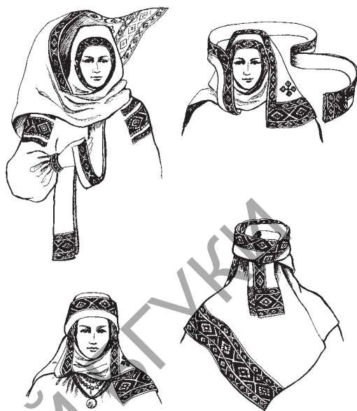
Мал. 3. Спосаб завівання пята. в. Збураж Маларыцкага раёна Брэсцкай вобласці. Рэканструкцыя і малюнак М. Віннікавай

Адзенне жыхароў паўднёва-заходняй часткі Брэстчыны адрознівалася каларыстычнай насычанасцю, багаццем арнаментальнага аздаблення. Стылістычным адзінствам мастацка-дэкаратыўнага вырашэння, вытанчанасцю дробнай геаметрычнай арнаментыкі, уведзенай у кампазіцыю з вузкіх чырвоных палос, вызначаецца Кобрынскі строй. Доўгі і шырокі плат (прыкладна 350x55 см), прыгожа завіты на галаве, надаваў строю замужняй жанчыны асаблівую грацыёзнасць. У в. Руховічы, напрыклад, плат завівалі наступным чынам. Правы канец яго складвалі ў вузкую палоску — «кібалку». Ён утвараў невялікі абручык кругом галавы і доўгую пятлю спераду, праз якую праходзіў левы канец пята, што павольна драпіраваўся на шыі, а потым накідваўся ззаду на «хахалык» — драўляную