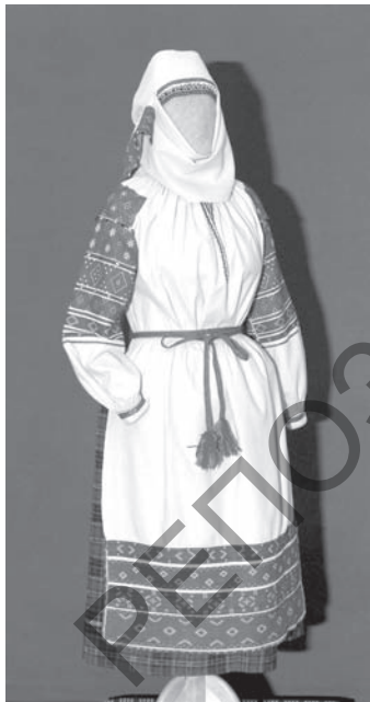
Мал. 8. Касцюм замужняй жанчыны. Канец XIX — пачатак XX ст. Старадарожскі раён Мінскай вобласці

арнаменту, які ўкладаўся ў традыцыйныя шмаг'ярусныя кампазіцыі, немалаважную ролю адыгрывалі фонавыя прабелы. Яны надавалі арнаментальным матывам лёгкаўспрымальны сілуэт і выразна выяўлялі іх графічны змест. Яркім прыкладам з'яўляецца жаночы касцюм Старадарожскага раёна. Для яго характэрна гармонія і ўраўнаважанасць усіх частак адзення, стрыманасць каларыту. Адметнасць касцюму надавала своеасабліва павітая наметка, якая на поўначы раёна (вёскі Дразна, Падарэссе, Залужжа) называлася «намётам». Канцы яе багата аздабляліся ткацтвам або вышыўкай, мярэжкамі і абшываліся мохрыкамі. Характэрная рыса аздаблення намёта — арнамент на двух яго канцах быў розны і нашываўся на розных баках палатна.