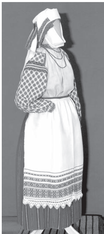
Мал. 6. Касцюм замужняй жанчыны. Пачатак XX ст. в. Лукі Калінкавіцкага раёна Гомельскай вобласці

прыладу, абшытую тканінай і падаткнутую зверху пад прычоску — валасы, скручаныя вузлом. Хахалык разам з прычоскай мацаваўся плеченым сеткаватым чапцом, да яго прышпільваўся накінуты левы канец плата (гл. мал. 1, 2).