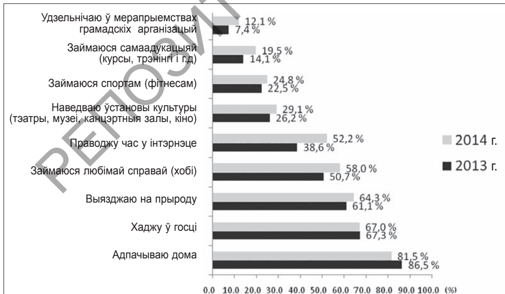
Мал. 1. Дынаміка фактычных адпачынкавых практык па гадах

На апошняй ступені адбору праводзіцца кантроль квот (для забеспячэння рэпрэзентатывнасці выбарачнай сукупнасці). У якасці прымет у даследаванні выступаюць пол, узрост і адукацыя. Крыніцай інфармацыі аб сацыяльна-дэмаграфічных характарыстыках насельніцтва з’яўляюцца даныя, атрыманыя ў ходзе перапісу насельніцтва рэспублікі ў 2009 г. Выбарачная сукупнасць у 2014 г. складала 2000 чалавек, у 2013 г. — 1545 рэспандэнтаў. Звернем увагу на дынаміку фактычных і пажаданых адпачынкавых практык рэспандэнтаў. Для вызначэння фактычных стратэгіяў адпачынкавых паводзін рэспандэнтам прапанавалася адказаць на пытанне «Як Вы звычайна праводзіце вольны час?». Атрыманыя даныя сведчаць: у разглядаемы перыяд структура фактычных адпачынкавых практык не змянілася; разам з тым зафіксавана, што значна павялічылася колькасць людзей, якія праводзяць свой вольны час у інтэрнэце (гл. мал. 1).