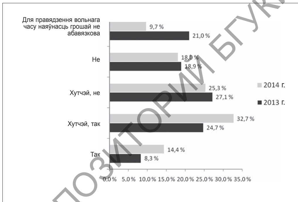
Мал. 5. Размеркаванне адказаў на пытанне «Ці дастаткова Вам грашовых сродкаў для правядзення вольнага часу?»

Асаблівая ўвага ў час правядзення даследавання была нададзена матэрыяльнай частцы вывучаемай праблематыкі, паколькі эканамічныя фактары дазваляюць пашырыць альбо абмежаваць доступ да тых ці іншых адпачынкавых практык. Вызначальным для гэтага паказчыка стала пытанне «Ці дастаткова Вам грашовых сродкаў для правядзення вольнага часу?». Данія праведзеных сацыялагічных даследаванняў сведчаць, што ў 2014 г. павялічылася колькасць рэспандэнтаў, якія адзначаюць задаволенасць наяўнымі фінансавымі сродкамі для правядзення вольнага часу. З іншага боку, зафіксавана змяншэнне колькасці рэспандэнтаў, якім для правядзення вольнага часу наяўнасць грошай не абавязкова (гл. мал. 5).