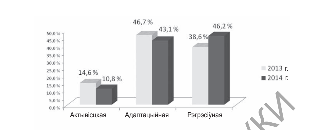
Мал. 6. Дынаміка эканамічных стратэгіі адпачынаковых паводзін па гадах

Варта адзначыць, што ва ўсіх узроставых групах: зменшылася колькасць рэспандэнтаў, якія прытрымліваюцца актывісцкай эканамічнай стратэгіі адпачынаковых паводзін;