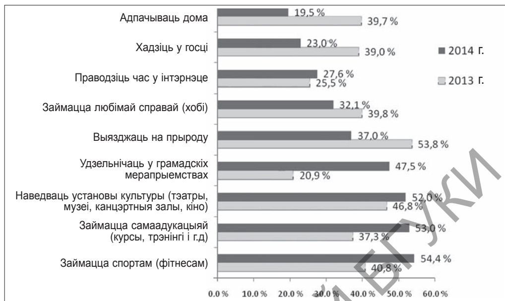
Мал. 2. Дынаміка жаданых адпачынаковых практык па гадах

У залежнасці ад узроставай прыметы зафіксавана: рэспандэнты ўсіх узроставых груп усё менш імкнуцца выязджаць на прыроду, займацца любімай справай, адпачываць дома, хадзіць у госці;