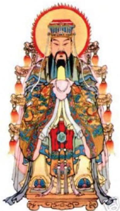
Рис. 3. Нефритовый император Юй-ди (верховное божество даосского пантеона). Его изображают как бесстрастного мудреца, который правит небом и делами людей