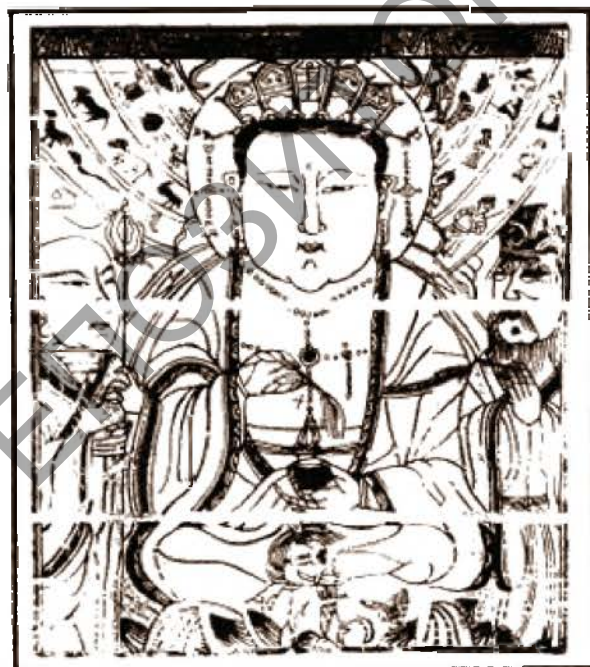
Рис. 2. Дицзан-ван – в китайской мифологии повелитель подземного царства