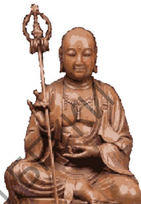
Рис. 4. Кшитигарбха – защитник земли и спаситель душ