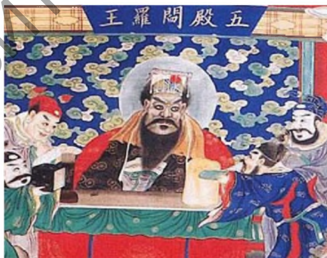
Рис. 5. Яньло-ван – в китайской мифологии бог Смерти, правитель ада со столицей в подземном г. Юду