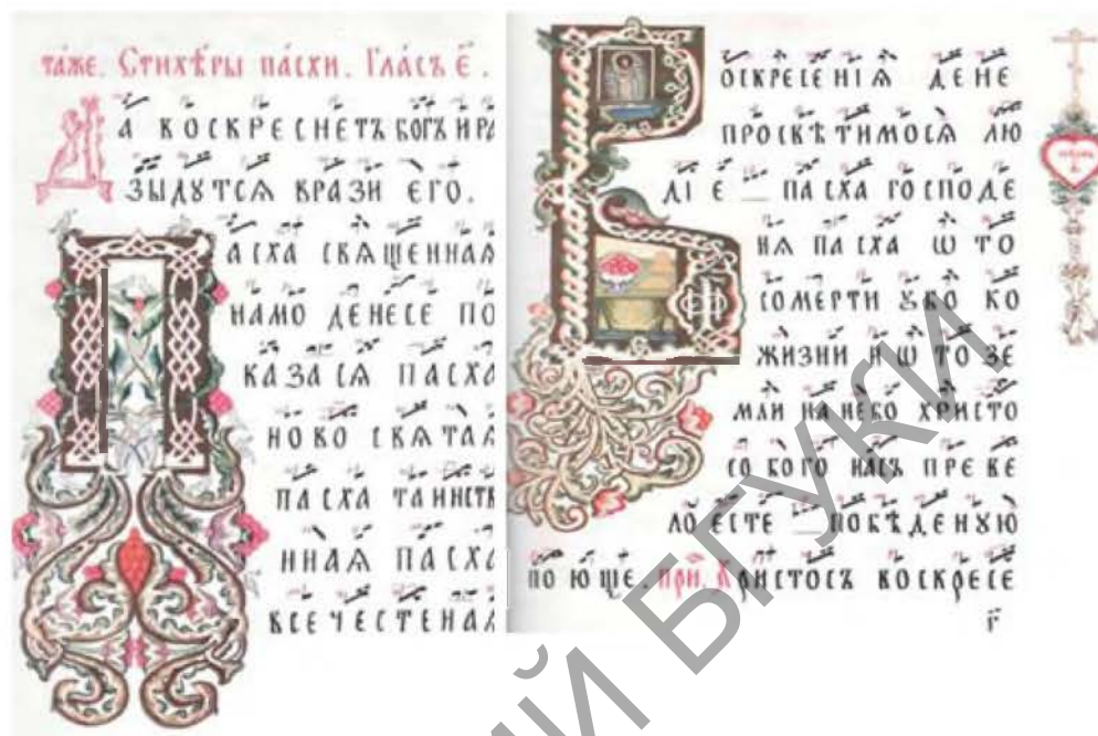
Рис. 1. Рукописная поморская книга конца XIX – начала XX в. (из частного фонда Л. Ф. Костюковец)