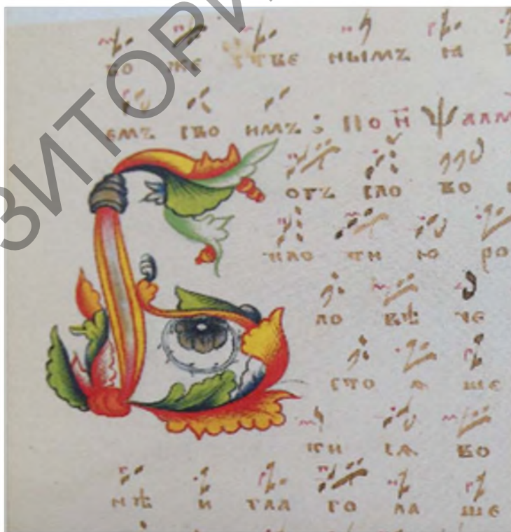
Рис. 6. Поздние певческие крюковые рукописи кон. XIX – нач. XX в. (из рукописного фонда Музея старообрядчества и белорусских традиций им. Ф. Г. Шклярова, г. Ветка)