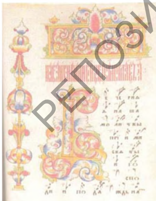
Рис. 4. Рукописная книга «Октоихъ», XIX в., Ветка (из рукописного фонда Музея старообрядчества и белорусских традиций им. Ф. Г. Шклярова, г. Ветка)