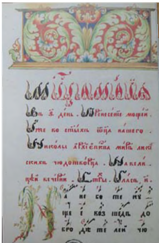
Рис. 3. «Стихирь» из рукописной книги. 1 четверть XIX в., Ветка (из рукописного фонда Музея старообрядчества и белорусских традиций им. Ф. Г. Шклярова, г. Ветка)