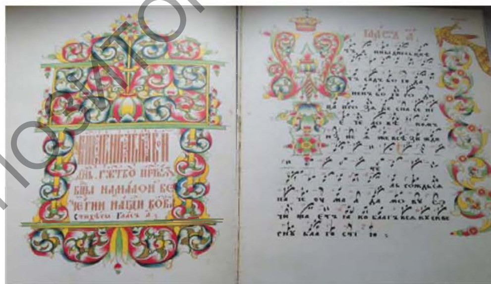
Рис. 2. Рукописная книга «Праздники» 1836 г., с. Гуслицы (из рукописного фонда Музея старообрядчества и белорусских традиций им. Ф. Г. Шклярова, г. Ветка)