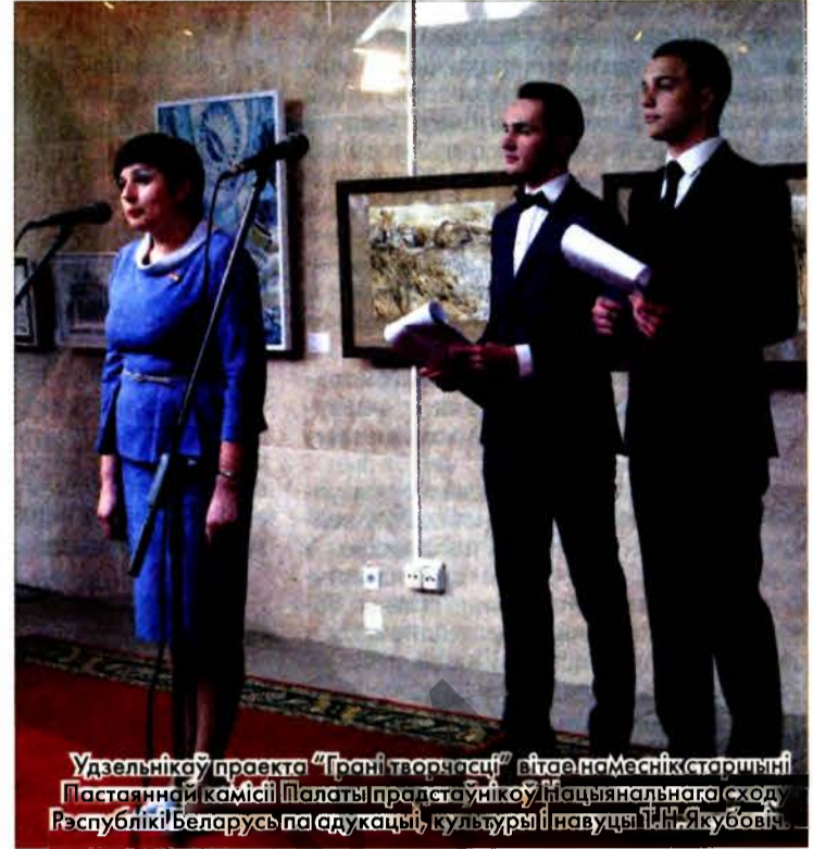
Удзельніца праекта “Грані творчасці” віце-намеснік старшыні Пастаяннай камісіі Палаты прадстаўнікоў Нацыянальнага сходу Рэспублікі Беларусь па адукацыі, культуры і навуцы І.Н. Якубовіч.