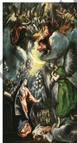
Мал. 4. Эль Грэка «Дабравешчанне»

З вядомых малюнкаў сцэны Дабравешчання на Беларусі можна адзначыць «Дабравешчанне» з праваслаўнай царквы Ражаства Багародзіцы горада Слаўгарада (Слаўгарадскі раён, Магілёўская вобласць). Царква была пабудавана ў 1791–1793 гг. Служкі сцвярджалі, што гэты малюнак датуецца гэтым жа часам, што і сама царква.