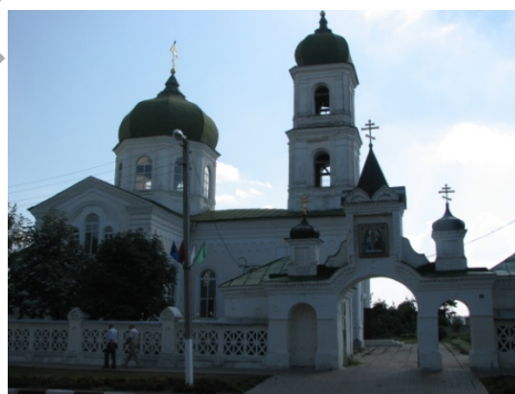
Мал. 9/10. «Дабравешчанне» / царква Аляксандра Неўскага (г. Мсціслаў)

Апошнія сюжэты (не гледзячы на тое, што знаходзяцца ў праваслаўных храмах) не вельмі падобныя на кананічныя візантыйскія або старажытнарускія выявы. Але ж і не надта падобныя да еўрапейскіх выяў. Хутчэй, гэта нешта сярэдняе паміж усходнім іканапісам і заходнім рэлігійным жывапісам. Па становішчы фігур (жэст дабраслаўлення Архангела Гаўрыіла, узнятае яго адно крыло, пакорлівыя лікі), можна ўбачыць іканапісныя традыцыі. Але ёсць нешта больш рэальнае, змяное ў поглядах, станах ад ідэй заходняга рэлігійнага жывапісу. Праваслаўныя іканапісцы спрабавалі адлюстраваць чароўнае адкрыццё, вышэйшую, незямную падзею, толькі злёг-