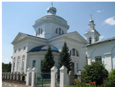
Мал.5/6. «Дабравешчанне» / царква Ражаства Багародзіцы (г. Слаўгарад)