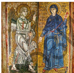
Мал. 1. Мазайка Сабора Святой Сафіі ў Кіеве (XI ст.)

«Дабравешчанне» у традыцыйных візантыйскіх ізводах выглядае так: Архангел Гаўрыіл, злятаючы з нябёсаў, звяртаючы погляд свой на Марыю, паведамляе ёй Добрую вестку і бласлаўляе жэстам (альбо абедзве рукі ўздымае да Багародзіцы, альбо адной рукой трымае крыж ці світак са словамі прывітання). Марыя напісана ў правай частцы малюнка, часцей стаіць насупраць Архангела, часам, сядзіць, быццам на троне, і, паводле апокрыфаў, трымае ў руках ці верацяно (прадзе завесу для Ерусалімскага храма), ці гарлачык (чарпае ваду з крыніцы).