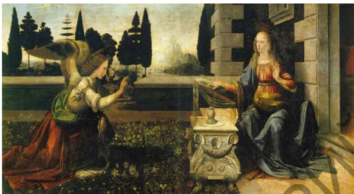
Мал. 3. Леанарда да Вінчы «Дабравешчанне»

кнігу прарока Ісайі, у момант з'яўлення Гаўрыіла. Але адрозненне было не толькі ў іншым ізводзе, – фон малюнка таксама меў іншую трактоўку. Так, італьянскія мастакі эпохі Адраджэння імкнуліся «адчыніць свет», таму пераносілі месца дзеяння ў адкрытую лоджыю або галерэю. Больш таго, мастакі, у прыватнасці, Леанарда да Вінчы, ставіць Марыю як бы ў больш дамінуючае становішча: яна вымушана глядзець зверху ўніз на Гаўрыіла, які схіліў калена перад Ёй. Іспанскі мастак Эль Грэка наогул «пераносіць» сюжэт у нябёсы.