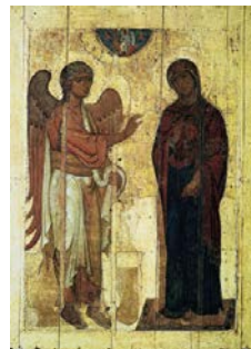
Мал.2. Усцюжскае Дабравешчанне

Праваслаўны канон напісання іконы «Дабравешчанне» адрозніваецца строгасцю, «незямным» малюнкам. Да таго ж праваслаўны ікананіс прытрымліваецца строгіх правілаў напісання: пласкаснае выяўленне, адваротная перспектыва.